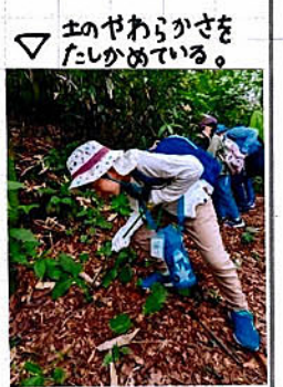
土のやわらかさをためている。

森ではふかふかの土が大切だと教わりました。ふつたりとスポンジのようになり、土の中に入れてみる生物が、そのよごれを取りのぞきます。土をうして、森できれいな水が生まれます。