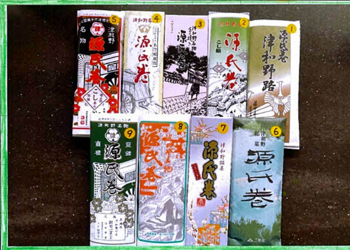
デザインもみせごとにながう9っ

※⑨⑧⑦⑥⑤④③②① さるは、今、 あこ村そさ三か山山ほ① さるは、今、 つし田うらのししい田山本ほう② さるは、今、 めあ一けのよ正竹ふうみ③ さるは、今、 まんだんとううどううけんどう④ さるは、今、 たけとうとうとうけんどう⑤ さるは、今、 だけとうとうとうけんどう⑥ さるは、今、 けとうとうとうけんどう⑦ さるは、今、 けとうとうとうけんどう⑧ さるは、今、 けとうとうとうけんどう⑨ さるは、今、