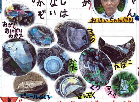
ごみひろい、サンジヨウカウオはだめ、なぐで！

日本でもめず らしいサンジヨウ ウオといういき ものがいます。 やすぎの川 にもいるので みつけてみたい です。